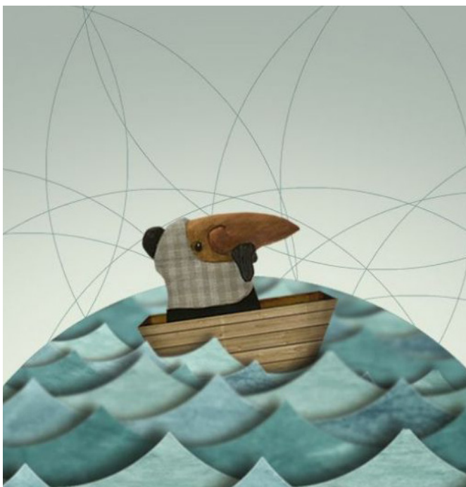
Le Voyage de Malenki