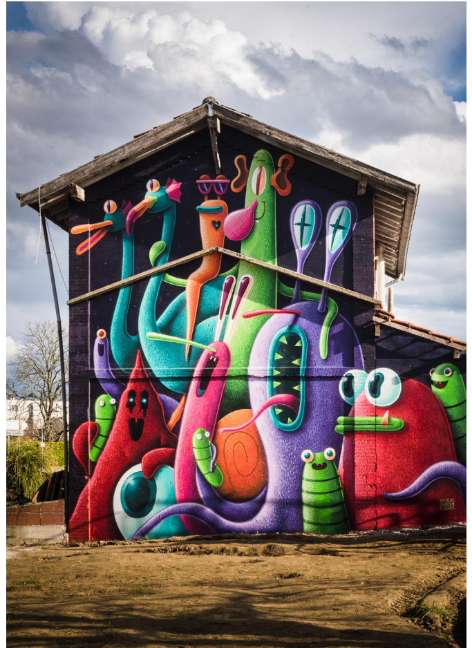
Les Promenades dessinées. Nicolas Barrôme Forgues

Programme complet disponible courant septembre sur www.bdcolomiers.com .